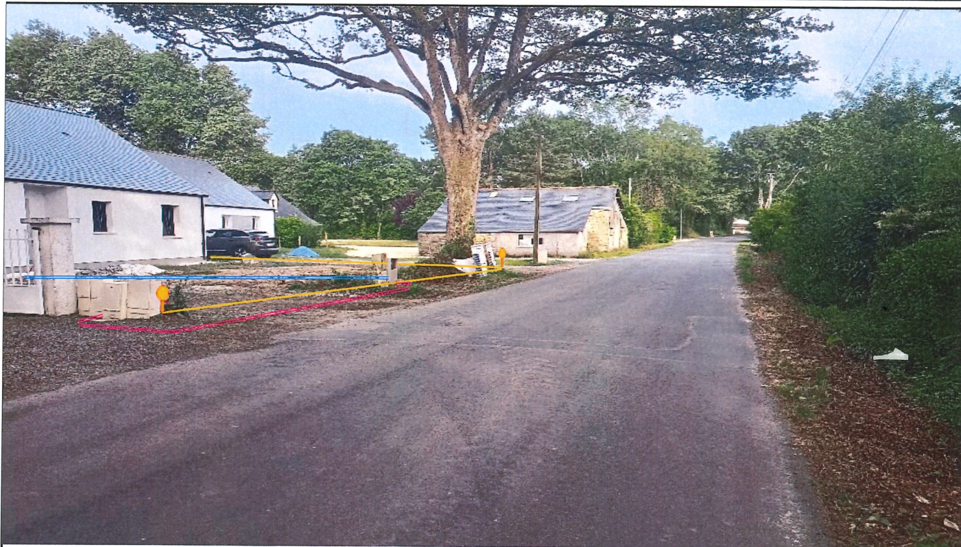
La solution technique est déterminée dans le respect de la norme NFC 14-100 en vigueur. Photo compteur non contractuelle