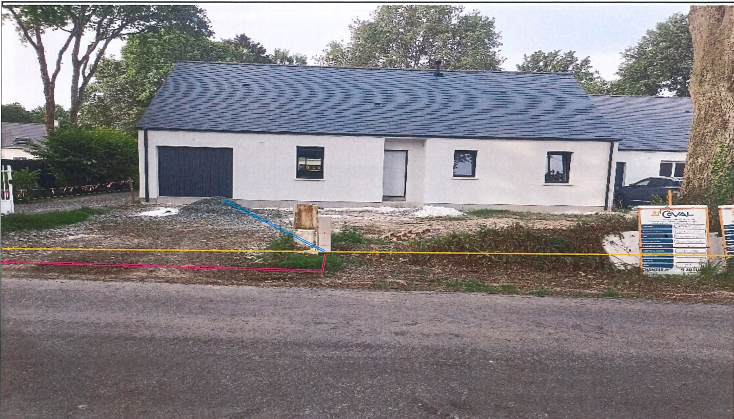
La solution technique est déterminée dans le respect de la norme NFC 14-100 en vigueur. Photo compteur non contractuelle