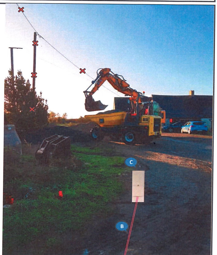
La solution technique est déterminée dans le respect de la norme NFC 14-100 en vigueur. Photo compteur non contractuelle