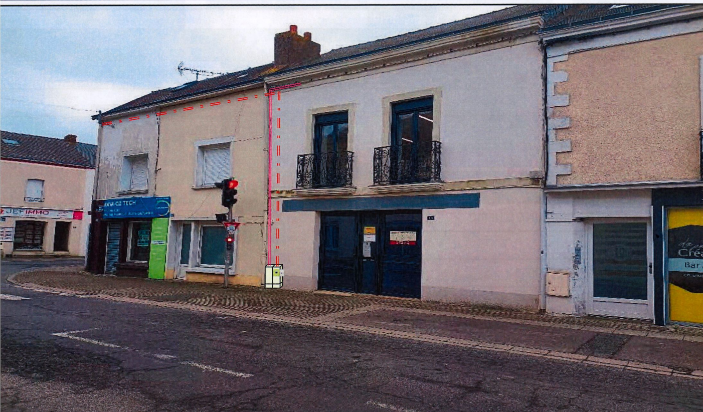
La solution technique est déterminée dans le respect de la norme NFC 14-100 en vigueur. Photo compteur non contractuelle